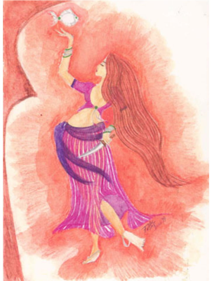
“Scherezade” de: Shamila Khetarpal Lápices de colores / 2002

Y así Scherezade relató sus historias por 1001 noches.